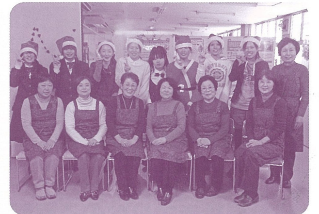
民生委員と学生スタッフ

そして、サロン活動の一環として鈴峯女子短期大学の学生との交流会が、12月10日の土曜日に行われました。この催しは、クリスマス会として毎年大学内で開催され、料理やゲームなどで地域との輪