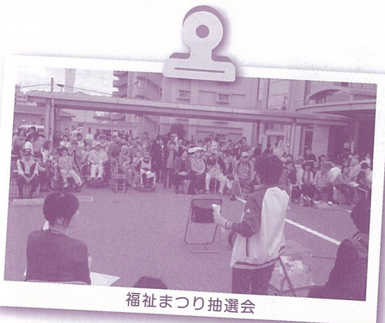
福祉まつり抽選会