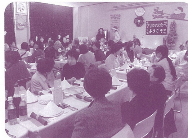
クリスマス会風景

高齢者と学生との交流の場は、「食」と「ふれあい」を通じた健康づくりや地域づくりを考える良い機会であるとともに、参加者からは、「おいしい料理はもちろんのこと、若い人からパワーをもらえるようで、元気になれる。」と笑顔で感想を話していただきました。